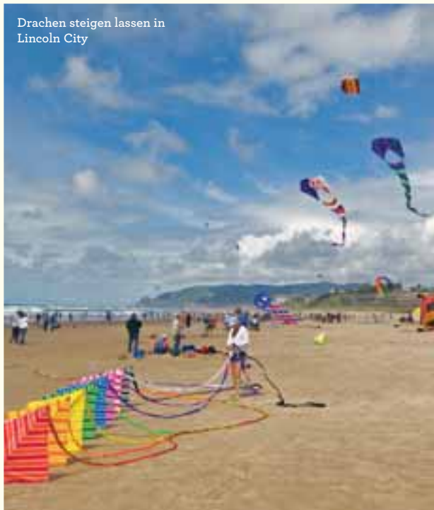
Drachen steigen lassen in Lincoln City