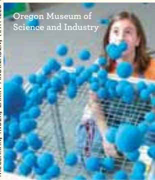
Oregon Museum of Science and Industry