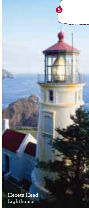
Heceta Head Lighthouse