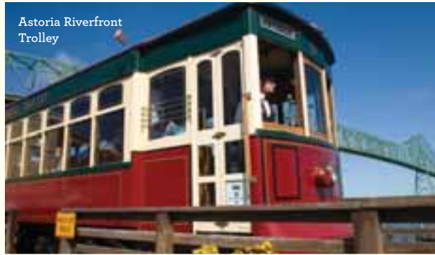
Astoria Riverfront Trolley

5. TAG | Starten Sie in den Tag mit einer Fahrt in einem Dünenbuggy durch die gewaltigen Sanddünen zwischen Florence und North Bend. The Oregon Connection in Coos Bay bietet kostenlose Touren durch die ehemalige Myrtenholzfabrik und -mühle an. Südlich von Bandon kommen Sie auf einer West Coast Game Park Safari hautnah an eine Vielzahl wunder- voller Tiere heran. Genießen Sie die kilometerlangen Strände von Gold Beach bei einem Spaziergang oder erkunden Sie den beeindruckenden Rogue River auf einem Schnellboot oder beim Rafting.