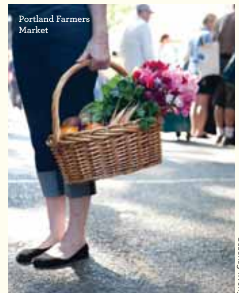
Portland Farmers Market

6. TAG | Von Februar bis Oktober findet das Oregon Shakespeare Festival statt. Zelebrieren Sie das britische Flair mit einem High Tea im Ashland Springs Hotel. Im März haben süße Genießer am Oregon Chocolate Festival ihre helle Freude. Auf Ihrem Weg durch das Applegate Valley finden Sie auf mehreren Weingütern Sorten wie Merlot, Cabernet Sauvignon, Syrah und Chardonnay.