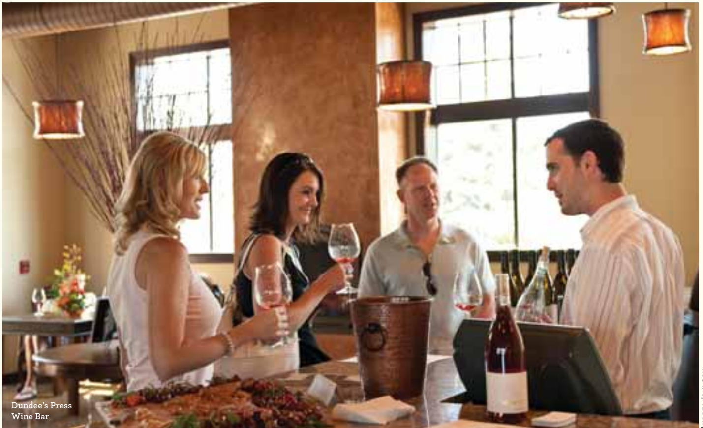
Dundee's Press Wine Bar